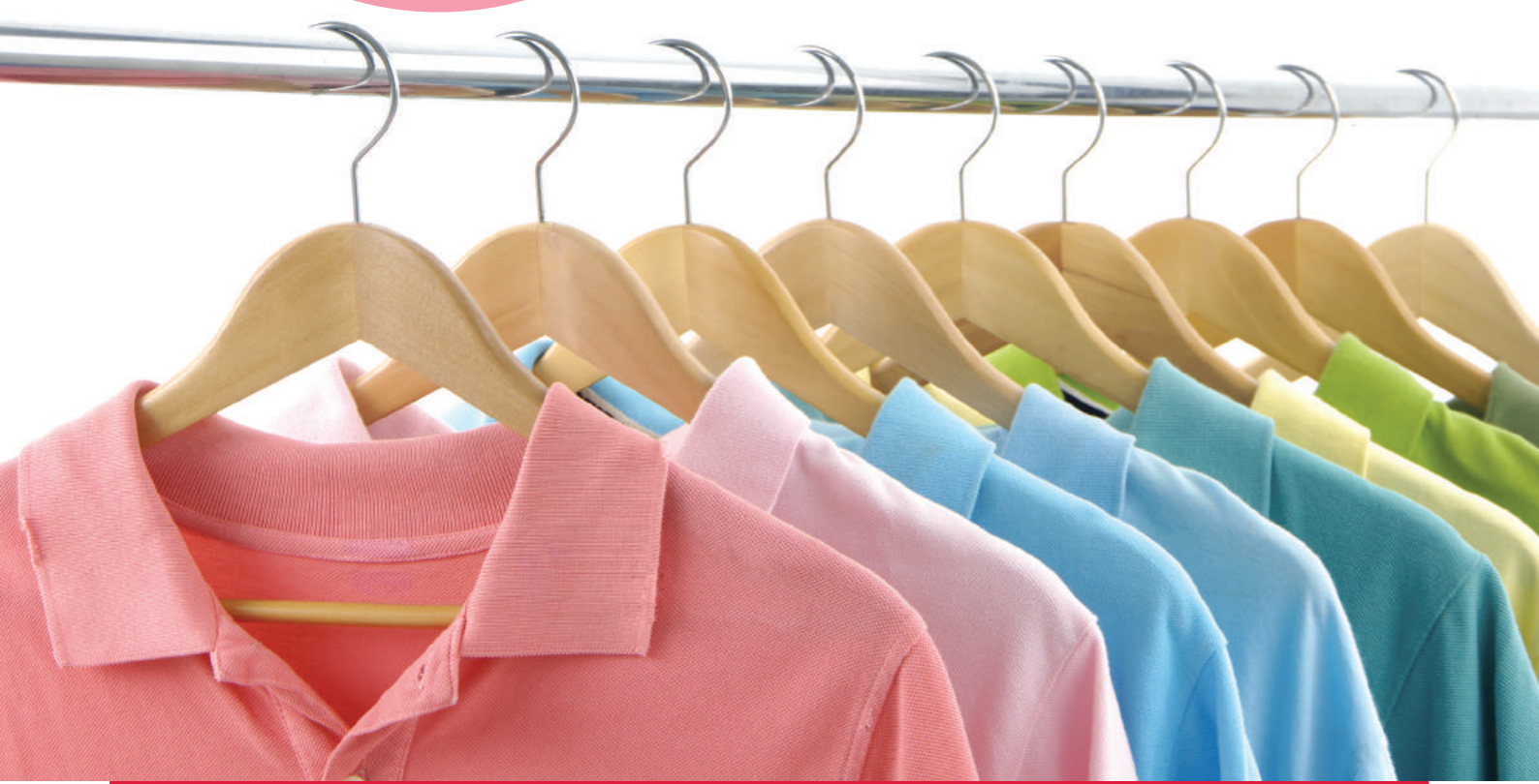
스마트보송 (Smart 'Posong') - 뜯어쓰는 제습제