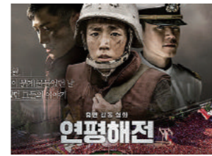
영화 "연평해전" 핫팩 협찬