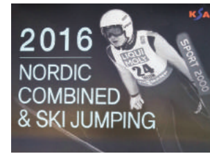
스키점프 국제스키연맹(FIS)컵 대회 핫팩 후원