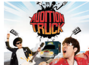
"오디션트럭" 핫팩 협찬