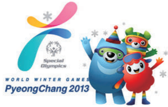
평창 스페셜 올림픽 공식후원