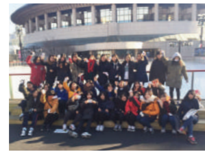
예술의전당 아이스링크 핫팩 후원