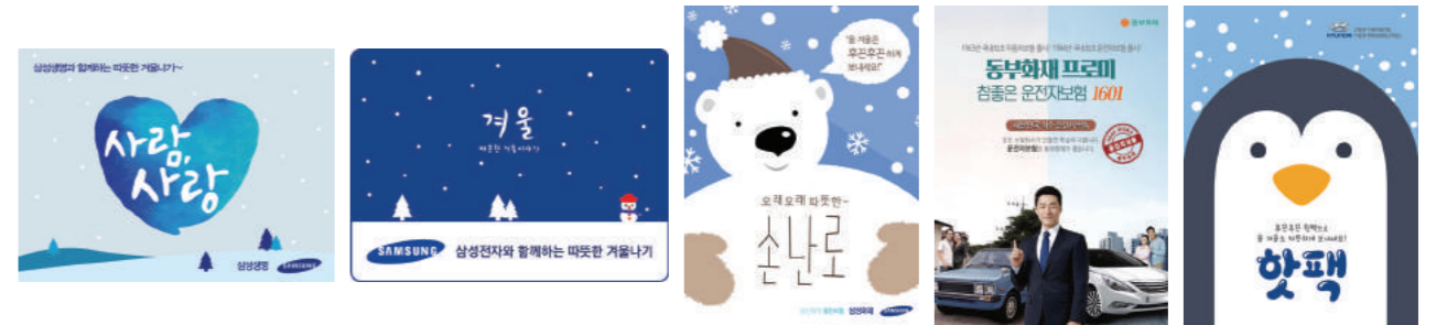
▶ 삼성생명 ▶ 삼성 디지털프라자 ▶ 삼성화재 ▶ 동부화재 ▶ 현대자동차