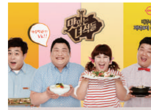
"맛있는 녀석들" 핫팩 협찬