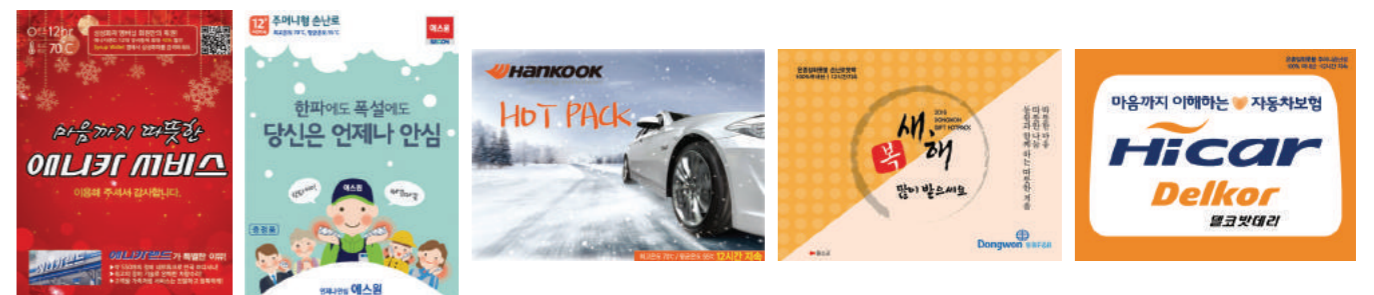
▶ 삼성 애니카 ▶ 삼성 에스원 ▶ 한국타이어 ▶ 동원F&B ▶ 현대 하이카