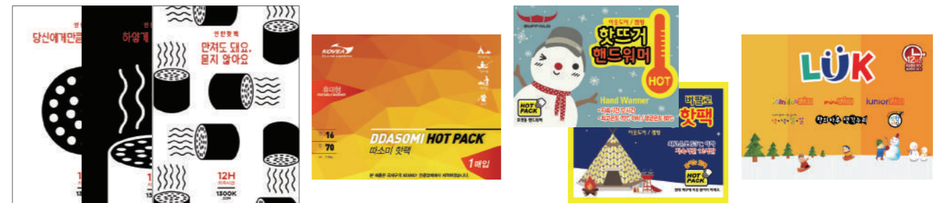
▶ 1300K ▶ 코베아 ▶ 버팔로 ▶ 루크박스