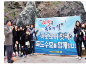
"10월은 독도의 달" 독도경비대에 핫팩 후원